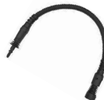
ADAPTOR DE ACCESORII