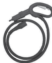
TUBURI DE PRELUNGIRE